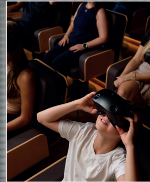
Stage 2 Raum der Zeitreise