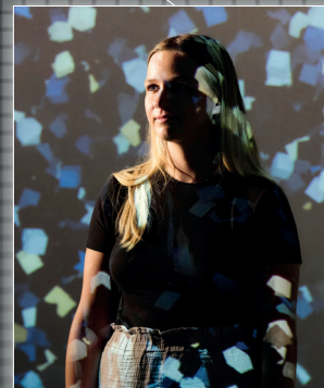
Stage 5 Raum der Emotionen